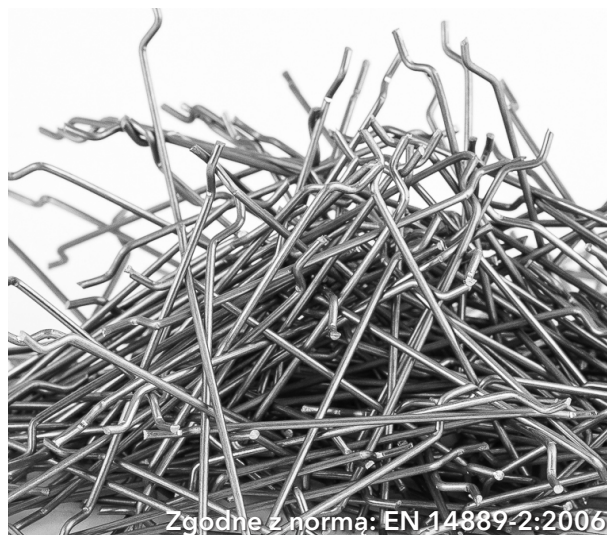
Zgodne z normą: EN 14889-2:2006

Dzięki swojej powtarzalności oraz sprężystości materiału, włókno FIBERSTEEL™ nie odkształca się i nie tworzy tzw. „jeży” podczas mieszania, co ułatwia jego równomierne połączenie z betonem i zapewnia jednorodność struktury. Włókna są również odpowiednio pakowane, aby zapobiec tworzeniu się „jeży” już na etapie transportu i przechowywania, co ułatwia ich późniejsze dodanie do mieszanki betonowej.